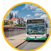
Stand Januar 2019 | Änderungen vorbehalten

Wie eine Königin thront die Albrechtsburg Meissen über dem malerischen Elbtal, überragt nur von den charakteristischen spitzen Türmen des Meißner Doms. Entstanden im 15. Jahrhundert, gilt sie als ältestes Schloss Deutschlands. In vergangenen Jahrhunderten war sie nicht nur architektonisch ein wahrer Trendsetter und versetzte die Menschen ins Staunen. Die raffinierten Gewölbeformen und aufwärtsstrebenden Linien schienen den Himmel greifbar zu machen. Auch in den folgenden Jahrhunderten – ob als erste europäische Porzellanmanufaktur oder mit atemberaubender Innenraumgestaltung – blieb die Albrechtsburg Meissen ihrer Zeit stets einen Schritt voraus. Die moderne, interaktive Ausstellung knüpft an die Tradition als Trendsetter an. Virtuelle Inszenierungen und interaktive Medienstationen ergänzen die Ausstellungsarchitektur und geben die Möglichkeit, in die Geschichte(n) der Albrechtsburg Meissen einzutauchen. Lassen Sie sich von der zeitlosen Schönheit der Albrechtsburg Meissen bezaubern. Alle Etagen des Schlosses sind heute für Besucher zugänglich.